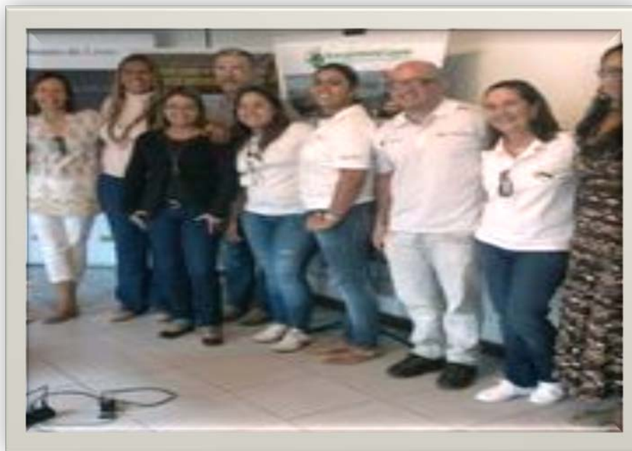
Foto 2- Evento do Subcomitê do sistema Lagunar de Jacarepaguá, na Semana de Meio Ambiente, realizado no Bosque da Barra.