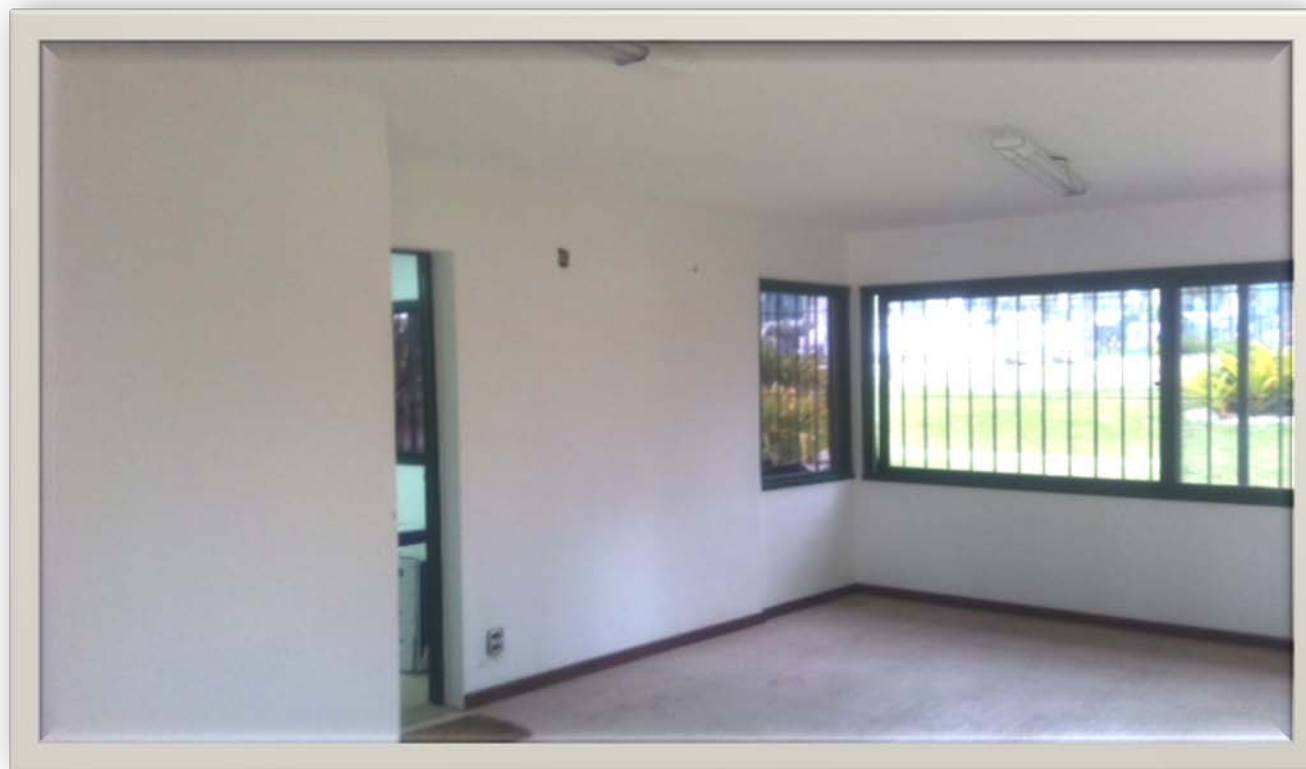
Foto 3- Salão principal reformado

As fotos a seguir apresentam a situação do prédio, atualmente, após as obras realizadas pela Associação dos Moradores da Península- ASSAPE.